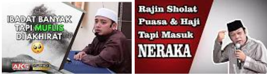
AMALAN 7 LANGIT ( Hadits dari Mu'adz bin Jabbal r.a )